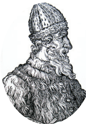
Великий князь Иван III

До XVIII века чиновники на Руси жили благодаря так называемым «кормлениям», то есть, при отсутствии оклада за исправление должности, разрешению на подношения от заинтересованных в их деятельности лиц. Одаривали их не только деньгами, но и «натурой» — мясом, рыбой, пирогами и пр., что было делом обыкновенным.