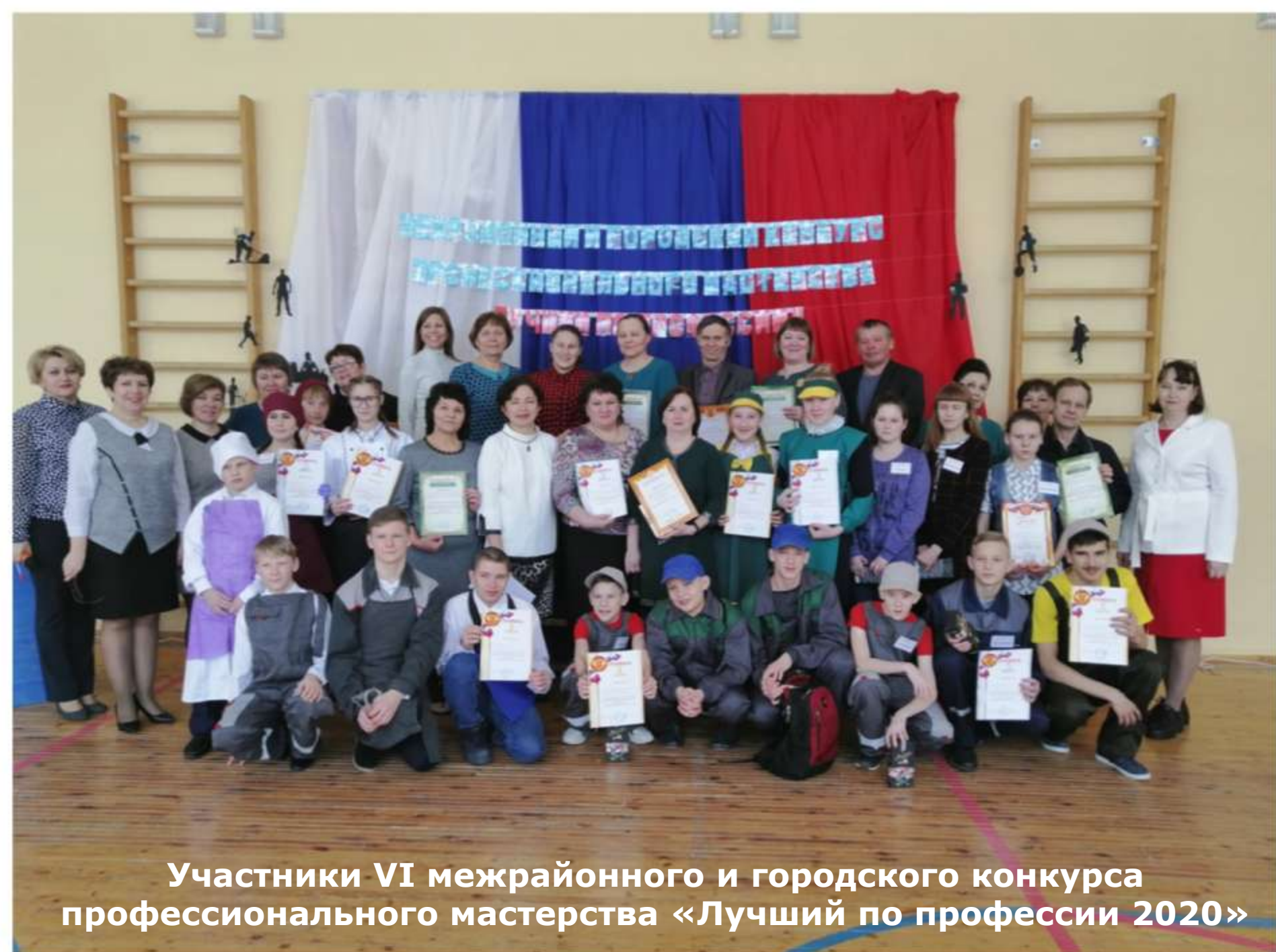
Участники VI межрайонного и городского конкурса профессионального мастерства «Лучший по профессии 2020»